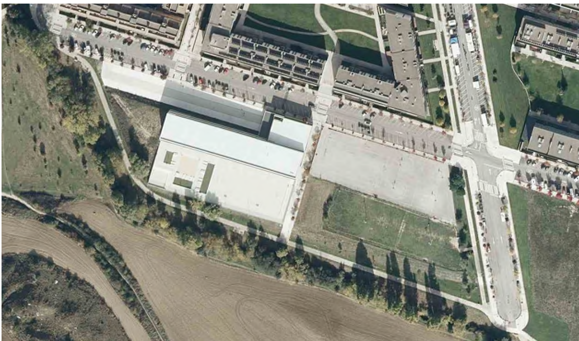
Imagen en la que se observa la parcela ECP-1A a izquierda y la parcela DD-14 a derecha con el paso peatonal entre ambas

Entre ambas parcelas se dispone un paso peatonal de unos 6 metros de ancho que comunica la calle Elizmendi con el espacio libre situado al sur de las mismas.